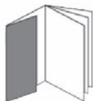
Gate-Folder, nach innen geklappter